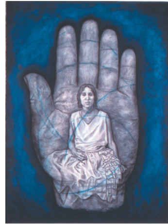
Уитфилд Ловелл, «Рука XIV», 1998 г., бумага, рашкуль, графит и пастель.